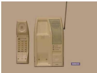
Téléphone Matra Aria -1992