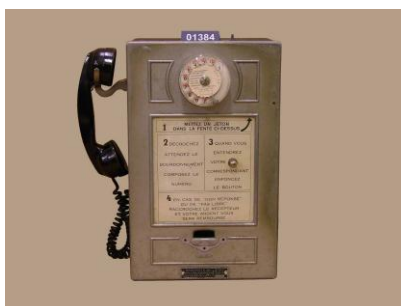
Publihone type 24 -1959

On s'empressa d'envoyer à Douvres un message en anglais « Cap Gris-Nez côtes de France, 8h.1/2 du soir. ». Le Goliath vient d'arriver sans aucun accident ; des compliments sont échangés pour la première fois par-dessous le détroit entre la France et l'Angleterre.