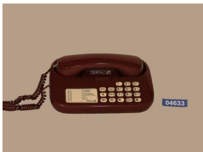
Téléphone T83 Chorus -1992