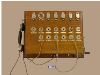
Téléphone mural Picard Lebas-1925