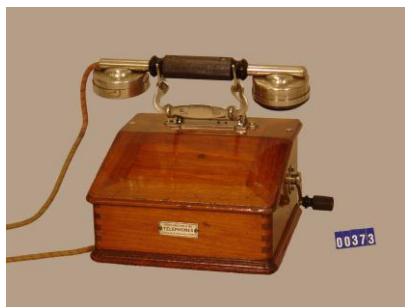
Téléphone type 1910 SIT-1924